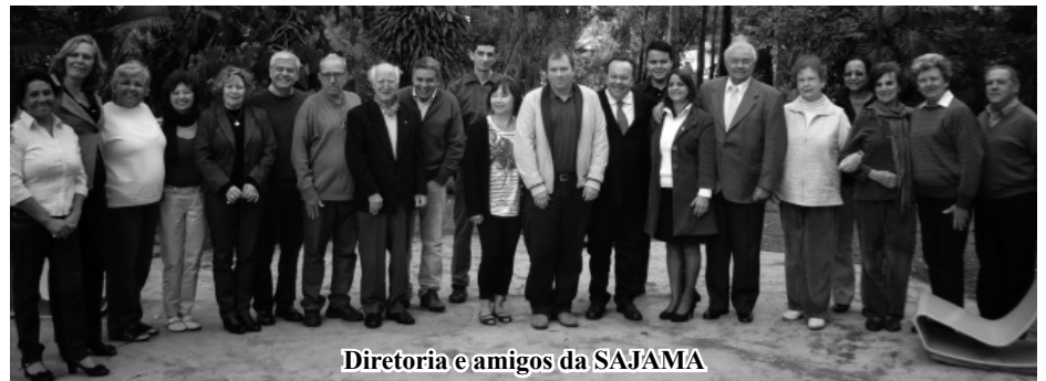
Diretoria e amigos da SAJAMA