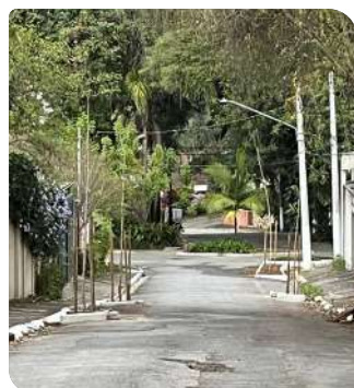
Manacá - Rua Major Arci Nobrega