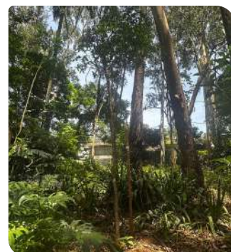
Perobas Rosa - Praça Hugo Sacco