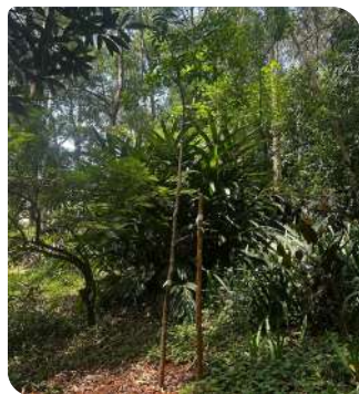
Guatambu - Praça Hugo Sacco