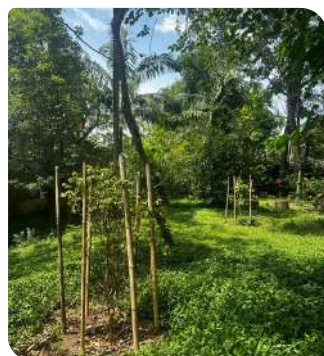
Jaboticabeira e Grumixama - Rua Mantis, 25 - Sede da Sajama