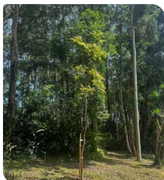
Guaritá - Praça Hugo Sacco