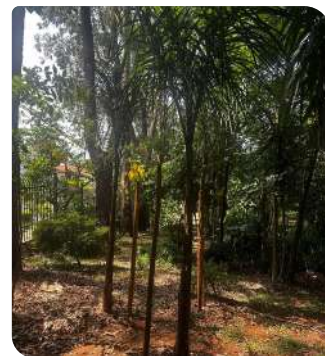
Juçara e Gariroba - Praça Samuel M. Antwarg

Desejamos a todos Boas Festas e um feliz Ano Novo, com a certeza de que juntos fazemos a diferença para enfrentar os desafios de 2024 !!!!