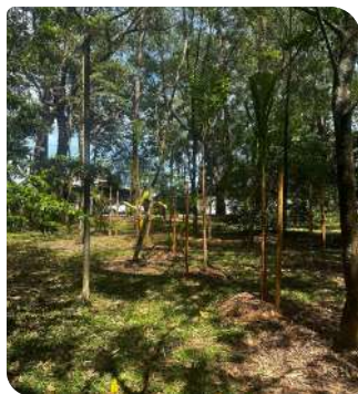
Gariroba - Praça Helio Siqueira