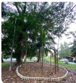
Gariroba - Praça Elfos