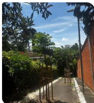
Carobinha - viela entre Rua Coreolano de Goes e Rua Lourenço Sgarb