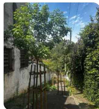
Ipê Rosa - viela entre Av. Manoel dos Reis Araújo e Rua Sérgio Millet