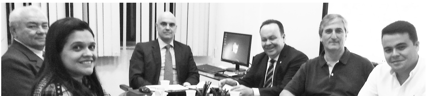
Reunião ocorrida na Secretaria de Segurança com o Dr. Alexandre de Moraes